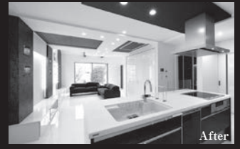
After LDKや玄関を使いやすい広さに間取り変更。減築し寝室を1Fにすることで生活動線を快適に。