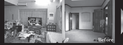
Before 広くて移動が大変なLDK。無駄な広さと物の多さで物置状態の玄関や部屋。

物置状態の広すぎるLDKを開取りを変更して、明るくシンプルでモダンな住まいへリフォーム。